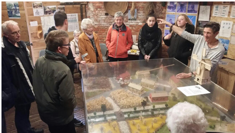
Rian haar uitleg sprak iedereen aan.

Deelnemers van Anders Creatief en Werkzin beleefden een mooie ochtend. Met na afloop ook nog koffie en gebak!