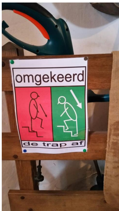
Valpreventie. Ook in de molen...!