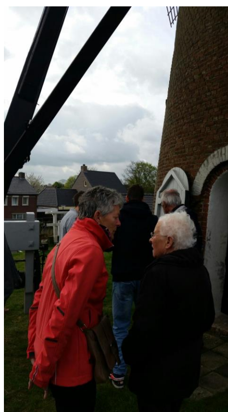
Toos woonde altijd in Luyksgestel en kwam nu voor de eerste keer in de molen. Geweldig!